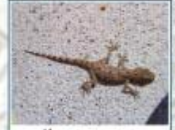
چە پچە پيسك