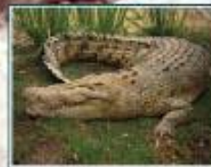
تىمساح : كرۇكۇدىل